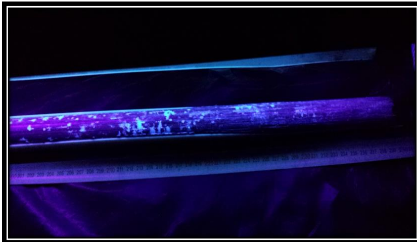
Figura 8. Detecção visual de produto no solo através de UV-A.