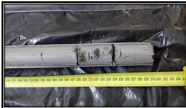
Figura 10. Seleção da amostra discreta a ser enviada ao laboratório após aplicação do UV-A.