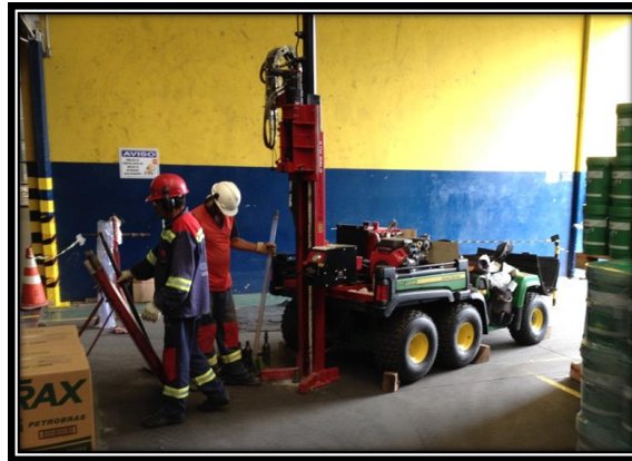
Figura 1. Sonda AMS Power Probe 9100 ATV efetuando operação Dual Tube Sampling .

- Ferramental para Cravação Contínua ( Direct Push ) com amostrador tubular liner modelo Dual Tube , onde o amostrador é revestido pelo tubo externo, e ambos são cravados simultaneamente. Além do amostrador tubular, o ferramental é composto de hastes prolongadoras, revestimentos prolongadores, acoplamentos e um retentor de amostras para auxiliar na recuperação do solo dentro do amostrador (Figuras 2 e 3). O amostrador tem 1,20 m de comprimento e 37 mm de diâmetro. O revestimento tem 1,20 m de comprimento e 70 mm de diâmetro 4 ;