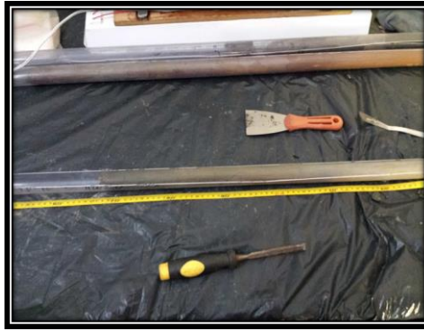
Figura 7. Amostras de solo nos liners abertos longitudinalmente com trena ao lado.