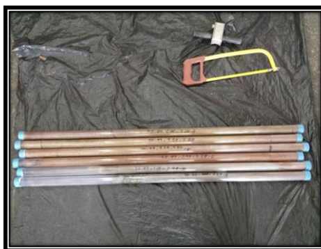
Figura 6. Amostras de solo nos liners , identificadas com suas respectivas profundidades.

Antes de cada coleta de amostras de solo em subsuperfície, foi executada uma sondagem de reconhecimento a trado manual com profundidade de 1,0 m como procedimento de segurança (NGWA, 2008), no intuito de identificar possíveis interferências subterrâneas (rede pluvial, esgoto, energia). Após cada sondagem, era efetuada a lavagem e descontaminação de todo o ferramental, de acordo com a norma ASTM 6282 (ASTM, 2014), para evitar contaminação cruzada entre os diferentes pontos de amostragem de solo.