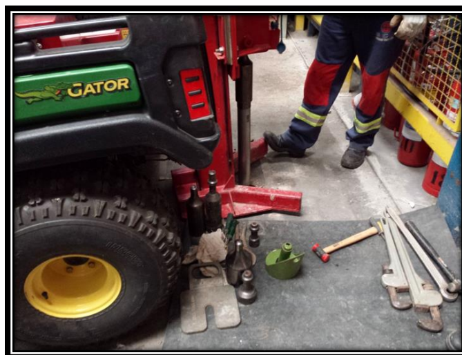
Figura 5. Cravação do equipamento Dual Tube para coletar amostras de solo.