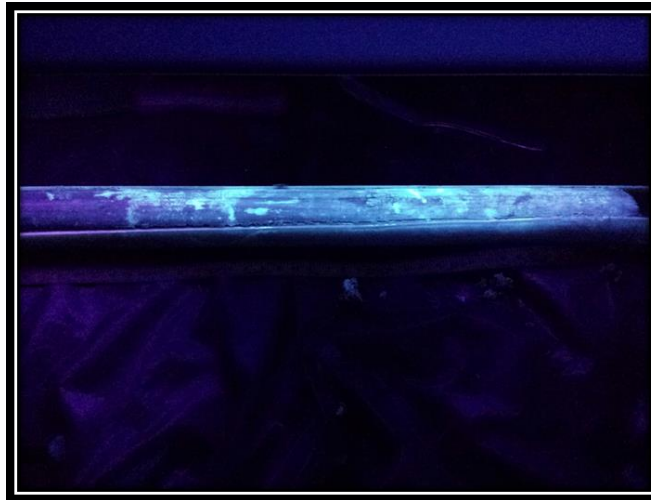
Figura 9. Detecção visual de produto no solo através de UV-A para registro fotográfico.